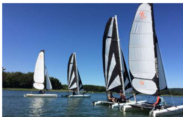
Balade en catamaran