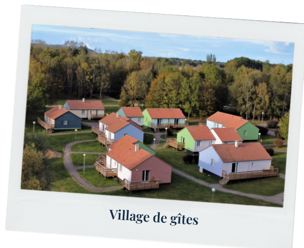
Village de gîtes