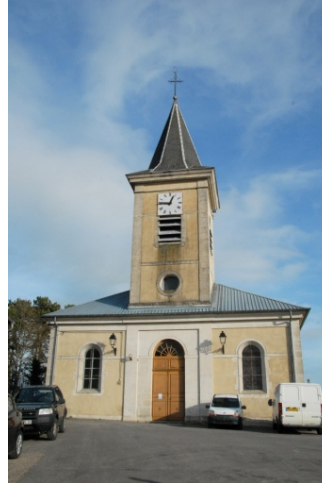
wp10 > l'église de l'Assomption