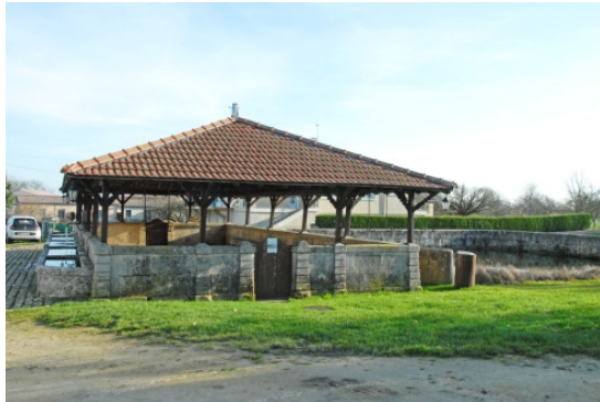
wp22 > lavoir du bas et son gayoir