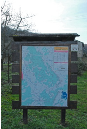
wp01 > panneau R.I.S