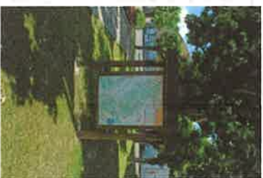
wp01 > panneau R.I.S.