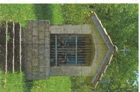
> Oratoire dédié à Marie