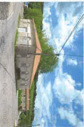
wp07 > ancien abattoir-abreuvoir