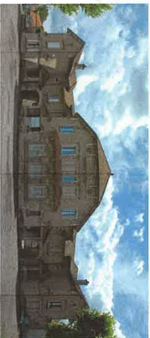
wp04 > ancienne école des filles et garçons