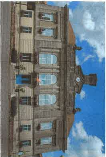
wp02 > Mairie