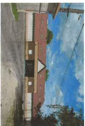
wp06 > salle polyvalente