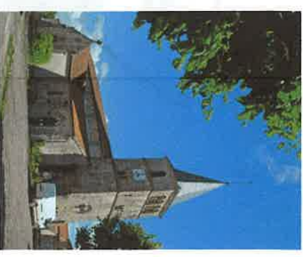
wp03 > Eglise Saint Rémy