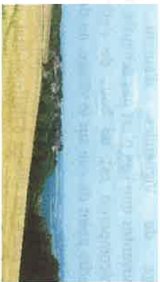
wp10 > vue sur Hattonchâtel