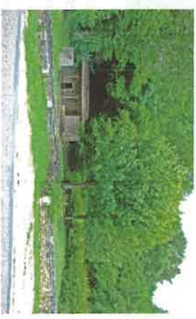
wp09 > lavoir des Romains