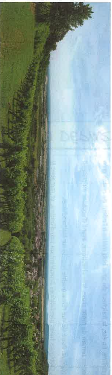
wp08 > vue sur les toits de Vigneulles