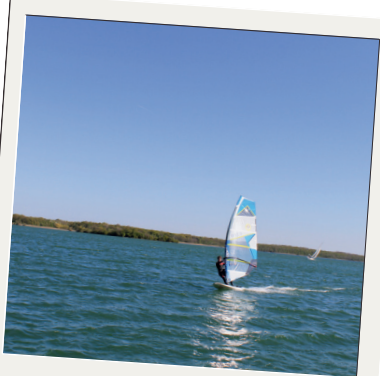
Planche à voile